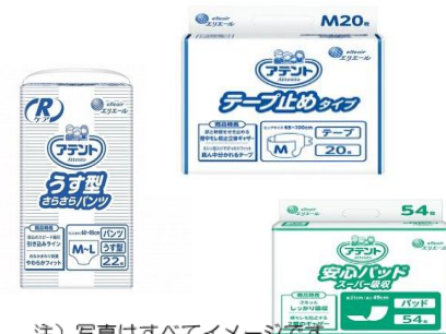
注) 写真はすべてイメージです

※「紙おむつセット」をご利用の患者様につきましては、衛生管理・廃棄処理管理の理由により、原則として外部からの持ち込みはご遠慮いただいておりますので、予めご了承ください。