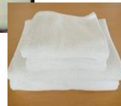
注) 写真はすべてイメージです