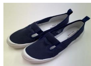
注) 写真はすべてイメージです